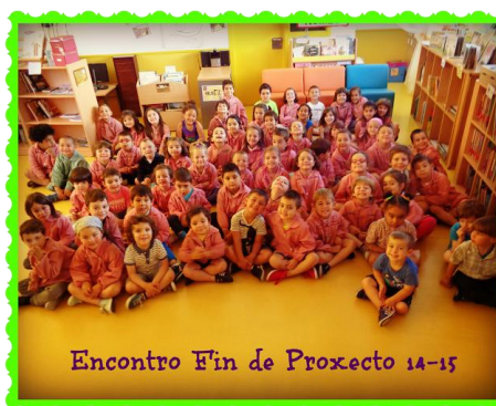
Encontro Fin de Proxecto 14-15

http://bibliobn.blogspot.com.es/2015/06/encontro-fin-do-rueiro.html