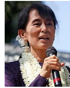
Aung San _____