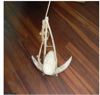
Poutada para o fondeo