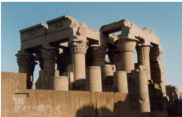
TEMPLO DE SOBEK (KOM OMBO)

Tras o Almorzo, saída cara a KOM OMBO . Visita do seu templo , situado nunha plataforma rochosa nun meandro do Nilo dedicado ao deus dos Crocodilos Sobek , cos seus textos gravados. Posteriormente seguiremos o Nilo entre belos e exóticas paisaxes cara a EDFÚ . Visita do templo mellor conservado de Exipto, dedicado ao deus Horus cuxa construción iniciouse no 237 a. C. Réxime de pensión completa e noite a bordo.