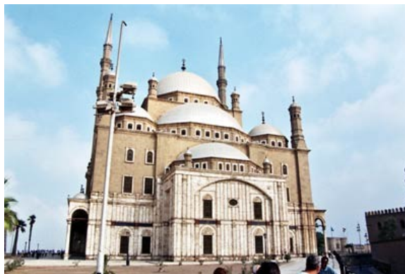
MESQUITA DE ALABASTRO

Visita á cidadela de Saladino . Saladino é unha das figuras máis importantes da historia do Mundo Islámico. Construíu sobre un outeiro da cidade do Cairo, unha cidadela fortificada que co tempo converteríase nun conxunto de mesquitas e palacios. Destaca a Mesquita de Alabastro .