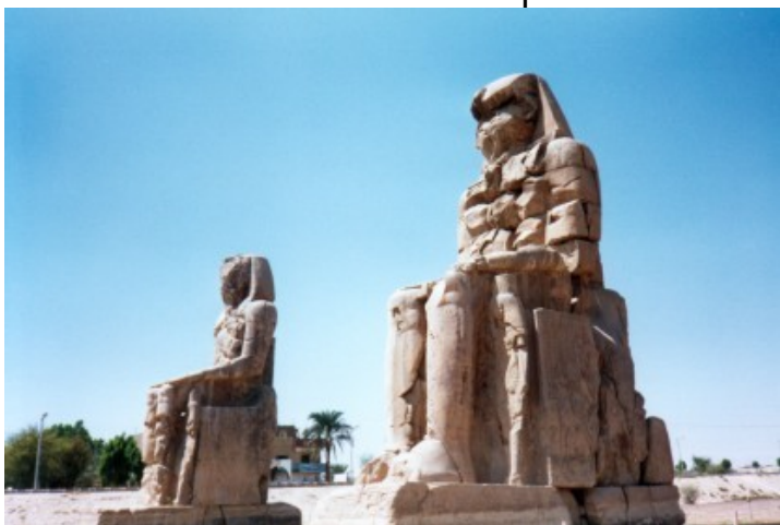
COLOSOS DE MENNON

Coñeceremos as fabulosas estatuas dos Colosos de Mennon , cos seus máis de 15 metros de altura, na beira oeste do Nilo, o Templo da raíña Hathsepsut , cunha arquitectura impresionante da XVIII dinastía e o Val dos Reis . Traslado ao aeroporto para saír no voo cara ao Cairo. Chegada e traslado ao hotel. Réxime en Pensión Completa.