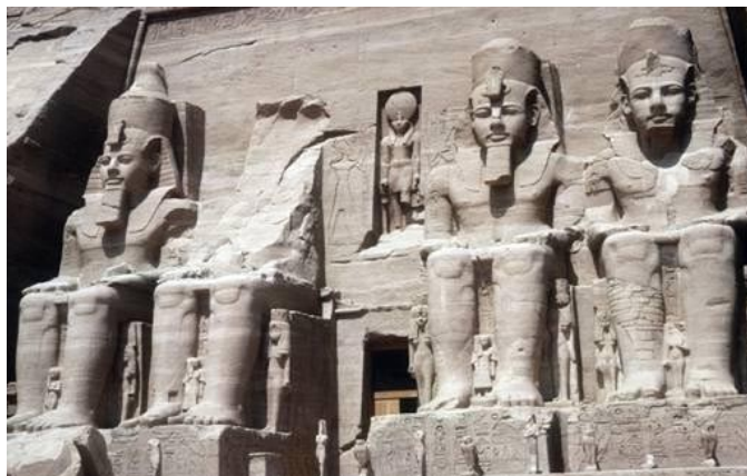
TEMPLO DE RAMSÉS II (ABU SIMBEL)

E como empezan as visitas aos templos exipcios , non nos viría mal ver un esquema da estrutura xeral dos mesmos. ¡Imos aló!