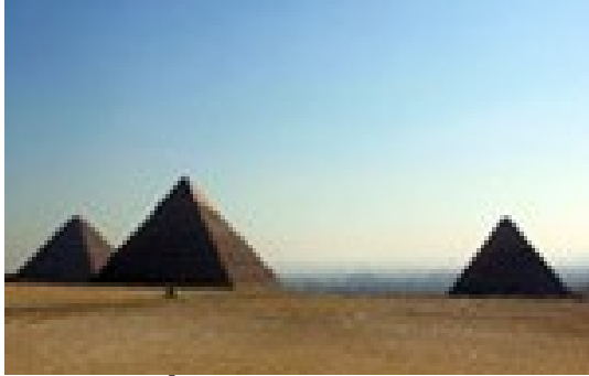
PIRÁMIDES DE GIZA

Almorzo no hotel. Incluímos a visita ás mundialmente famosas pirámides de Gizeh, formadas polas pirámides de Kefrén, Keops e Micerinos . Aos seus pés repousa a esfínxe con cabeza de faraón e corpo de león. É o único vestixio das Sete Marabillas