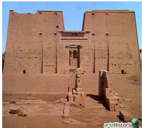
TEMPLO DE HORUS (EDFÚ)