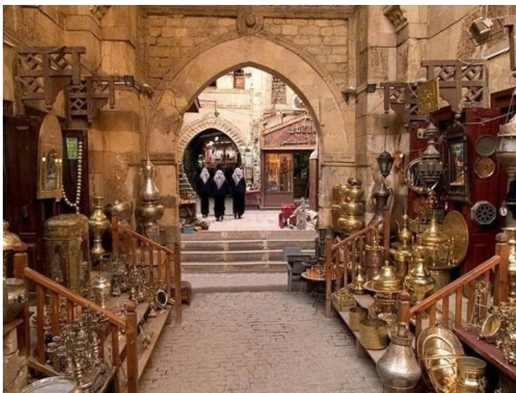
BAZAR DE KHAN EL KHALILI

Pola mañá, visitaremos o bazar do Khan o Khalili onde poderemos pasear polo seu zoco e apreciar o ambiente e aroma orientais.