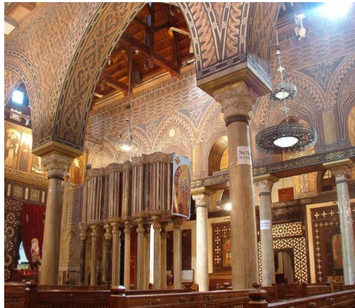
IGRESA DE SAN SERXIO

Visita á cidadela de Saladino . Saladino é unha das figuras máis importantes da historia do Mundo Islámico. Construíu sobre un outeiro da cidade do Cairo, unha cidadela fortificada que co tempo converteríase nun conxunto de mesquitas e palacios. Destaca a Mesquita de Alabastro .