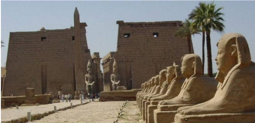
TEMPLO DE LUXOR; AVENIDA DAS ESFINXES, O OBELISCO E AS ESATUAS DE RAMSÉS II.

Visita ao templo de Luxor , descuberto en 1883 dedicado ao deus Amon-Ra onde destaca a Avenida das Esfinxes , o Obelisco con máis de 25 metros de altura e as estatuas de Ramses II e a Nave.