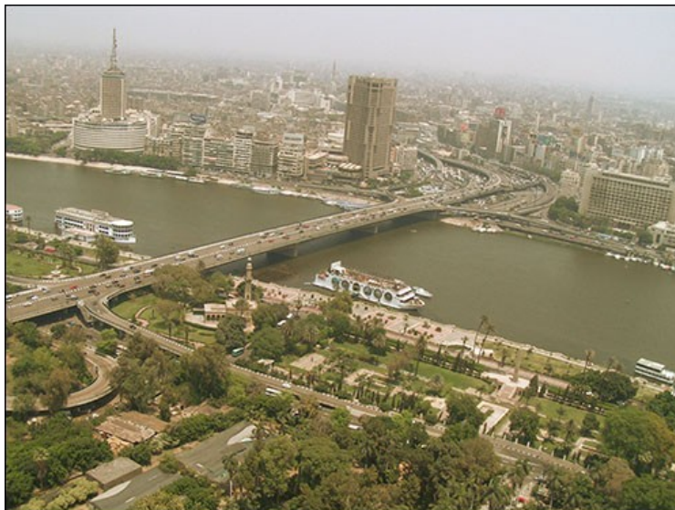
VISTA DO CAIRO DESDE A TORRE DO CAIRO.

Recollida ás 08:00. Visita ao Barrio Copto. O termo "copto" foi adoptado por os árabes para referirse á minoritaria comunidade de exipcios cristiáns. Neste barrio atópase a Sinagoga de Ben Ezra (é venerada pola tradición hebrea como o lugar no que Moisés foi recollido das augas do río pola filla do faraón), a igreja de San Serxio (onde a tradición conta que se refuxiou a sacra familia na súa fuxida a Exipto); a igrexa flotante, innumerables igrexas, pero o que resulta verdadeiramente importante é camiñar polos seus increíbles calexóns.