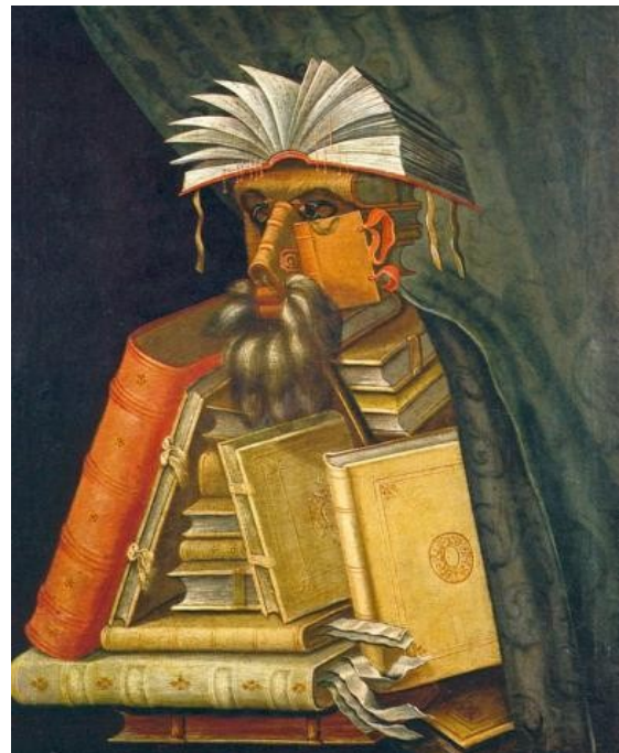
"O bibliotecario" (Giuseppe Arcimboldo)

R eflexión, recreo, refuxio, recollemento, rescate..