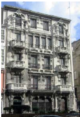
Rúa Juana de Vega