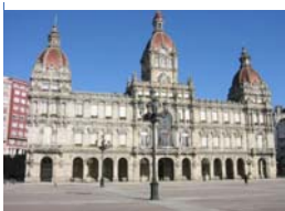
Concello Praza de María Pita