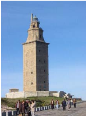
Torre de Hércules