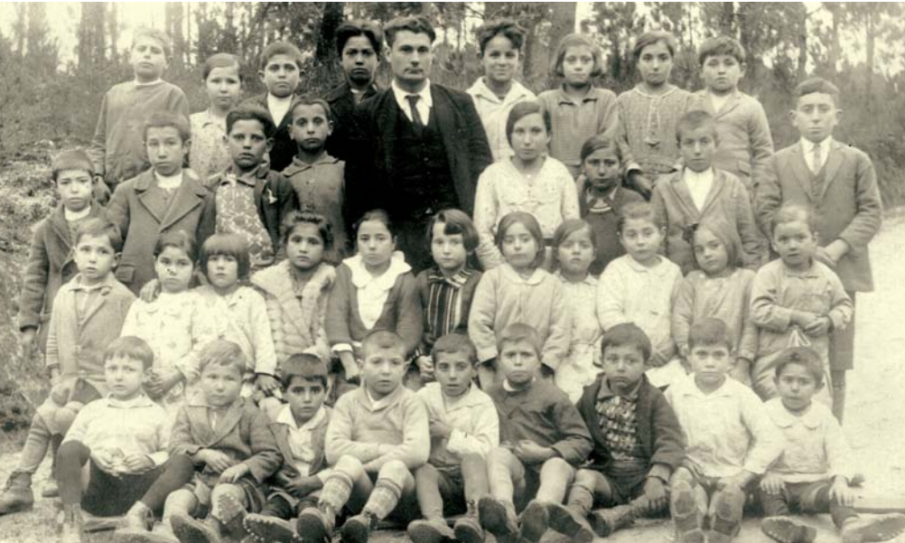
Escola do Milladoiro, Ames, A Coruña (1932)

acomodados da sociedade. Haberá que agardar á segunda metade do século XX para que esta situación comece a mudar.