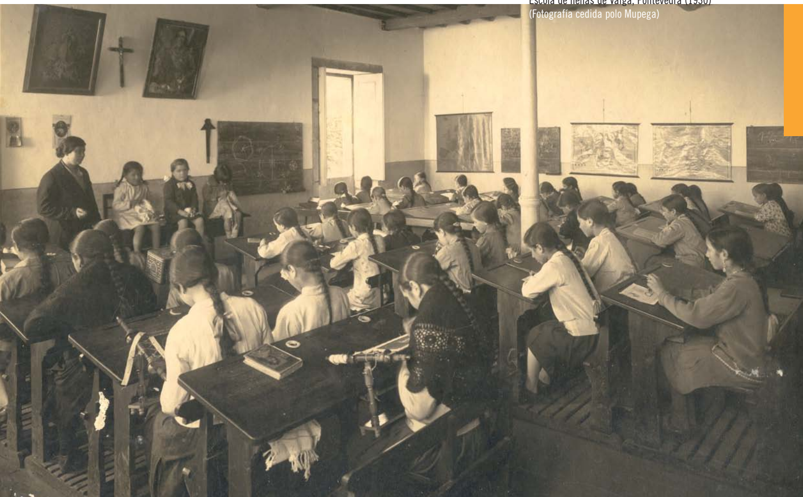
Escola de nenas de Valga, Pontevedra (1930)

Esta nova percepción explica o esforzo que moitos estaban dispostos a facer a prol da instrución pública. Poñerei un exemplo no que se ten reparado poucas veces. Como é sabido, as escolas públicas instaláronse as máis das ocasións, tanto no medio rural como no urbano, en locais improvisados que non reunían as condicións axeitadas. O primeiro edificio escolar propiamente dito que coñeceron moitas parroquias foi construído cos recursos fornecidos polos emigrantes. Pero tamén foi bastante común que os veciños dun determinado lugar constrúisen por conta propia -con achegas económicas, materiais e laborais- un edificio destinado a acoller a escola. Está por investigar a extensión desta práctica, que tamén se daba por estas datas noutras zonas de España, como nos conta Luis Bello. 11 Para os efectos que