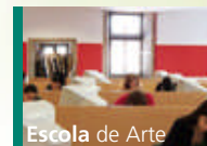
Escola de Arte