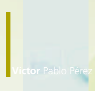
Víctor Pablo Pérez