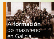
A formación do maxisterio en Galicia