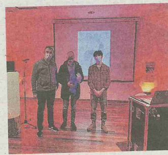
El ilustrador ofreció una charla en el Mome.