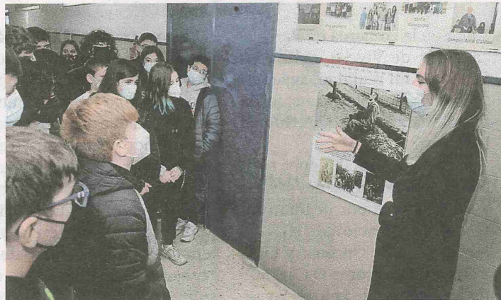
En el IES se inauguró ayer una muestra sobre el genocidio. E. C.